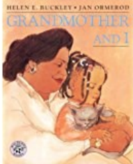
Grandmother and I by Helen E. Buckley