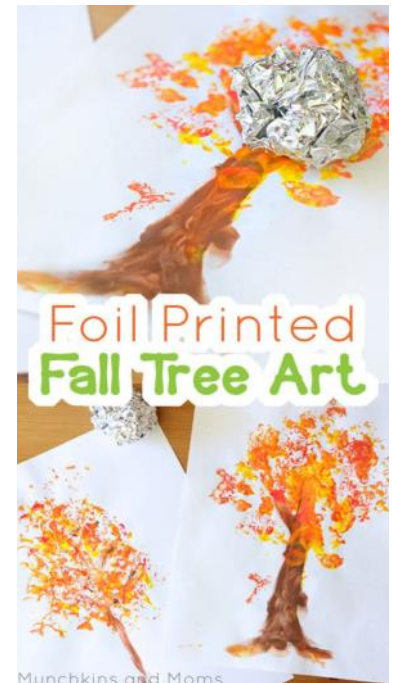
Munchkins and Moms

Este mes estamos haciendo un libro del alfabeto juntos. Cada grupo hará una página del libro, dedicada a la letra del día, encontrando imágenes de las cosas que comienzan con esa letra, y pegándolas a su página con pegamento.