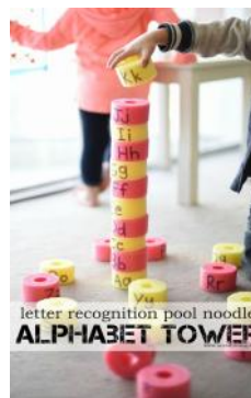
letter recognition pool noodle ALPHABET TOWER

Fideos de Piscina hacer grandes bloques de alfabeto. También se pueden amarrar con una cuerda, y rodarlo para abajo.