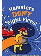
Los hámsters no combaten los incendios! Andrew Root